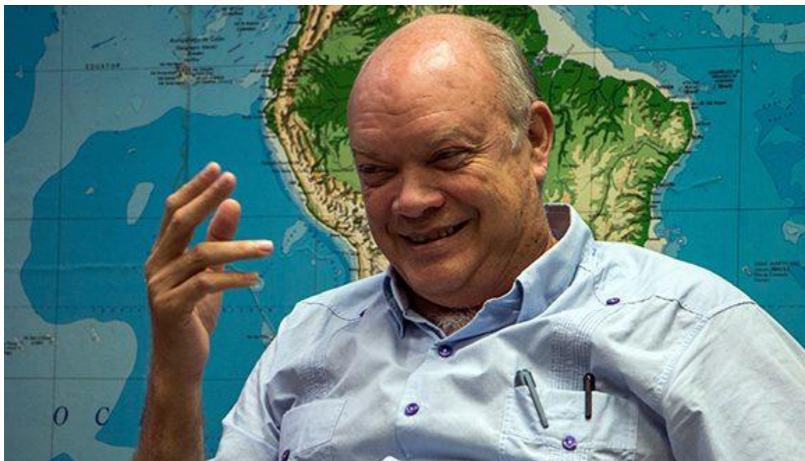
Rodrigo Malmierca Díaz, Ministro de Comercio Exterior y la Inversión Extranjera (Mincex), durante sus declaraciones a Cubadebate.

“Para el desempeño de esta tarea, nuestro Gobierno aprobó la “Estrategia de la Presidencia pro tempore cubana de la CEPAL”, un documento que estableció los objetivos esenciales y una serie de acciones a desarrollar; así como un plan de acción para su ejecución. Se ha mantenido un estrecho vínculo de trabajo con otros OACE y entidades nacionales, especialmente aquellos que son pilares del Grupo Nacional para la implementación de la Agenda 2030.