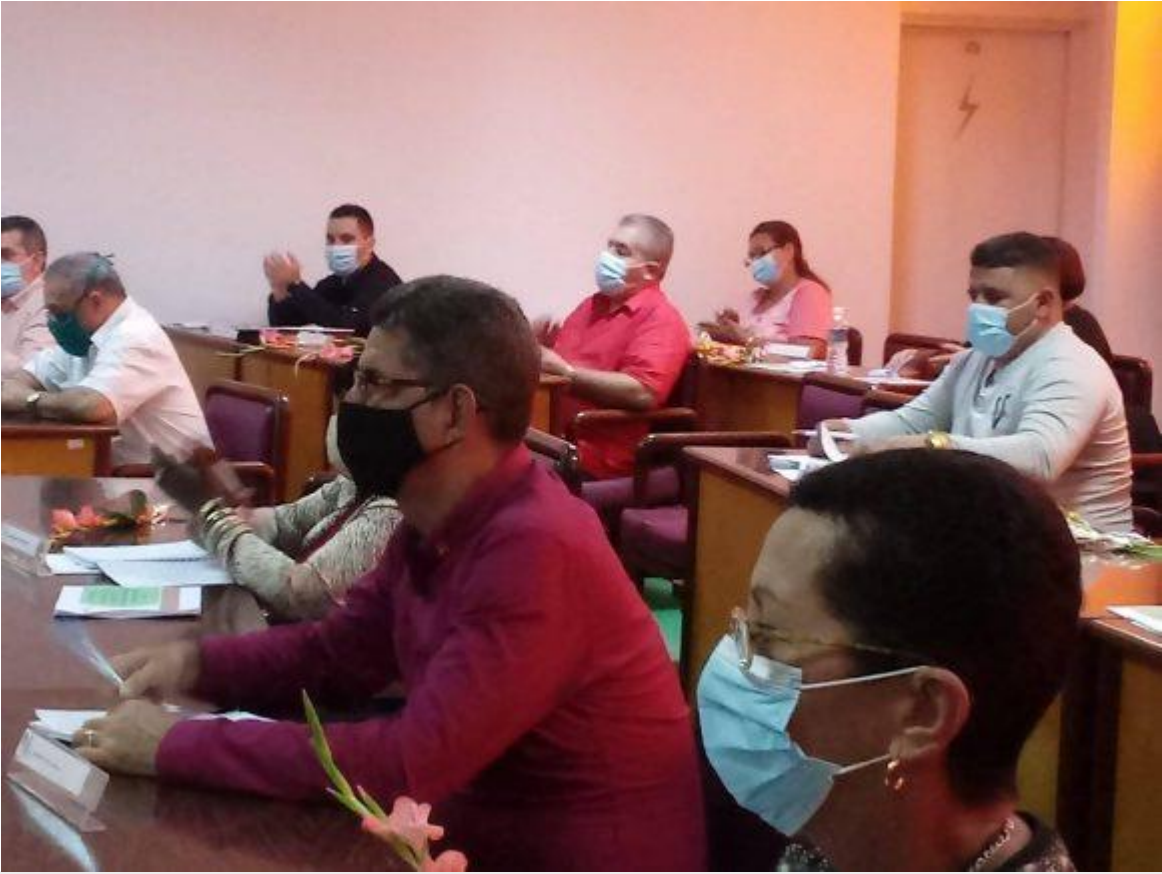
Diputados villaclareños participan en Asamblea Nacional.