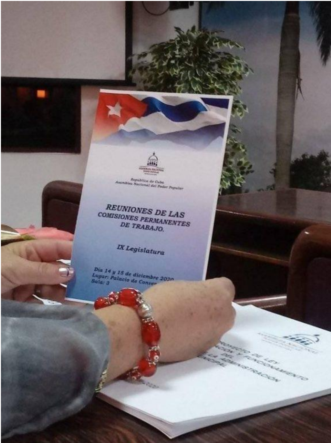
Diputados villaclareños participan en Asamblea Nacional.