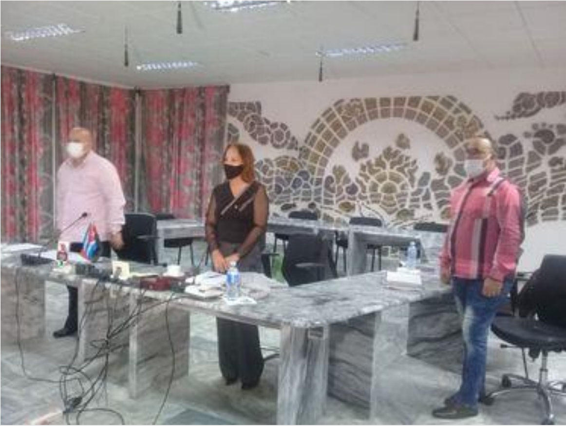
Diputados participan en sesión previa a la sesión ordinaria de la Asamblea Nacional.