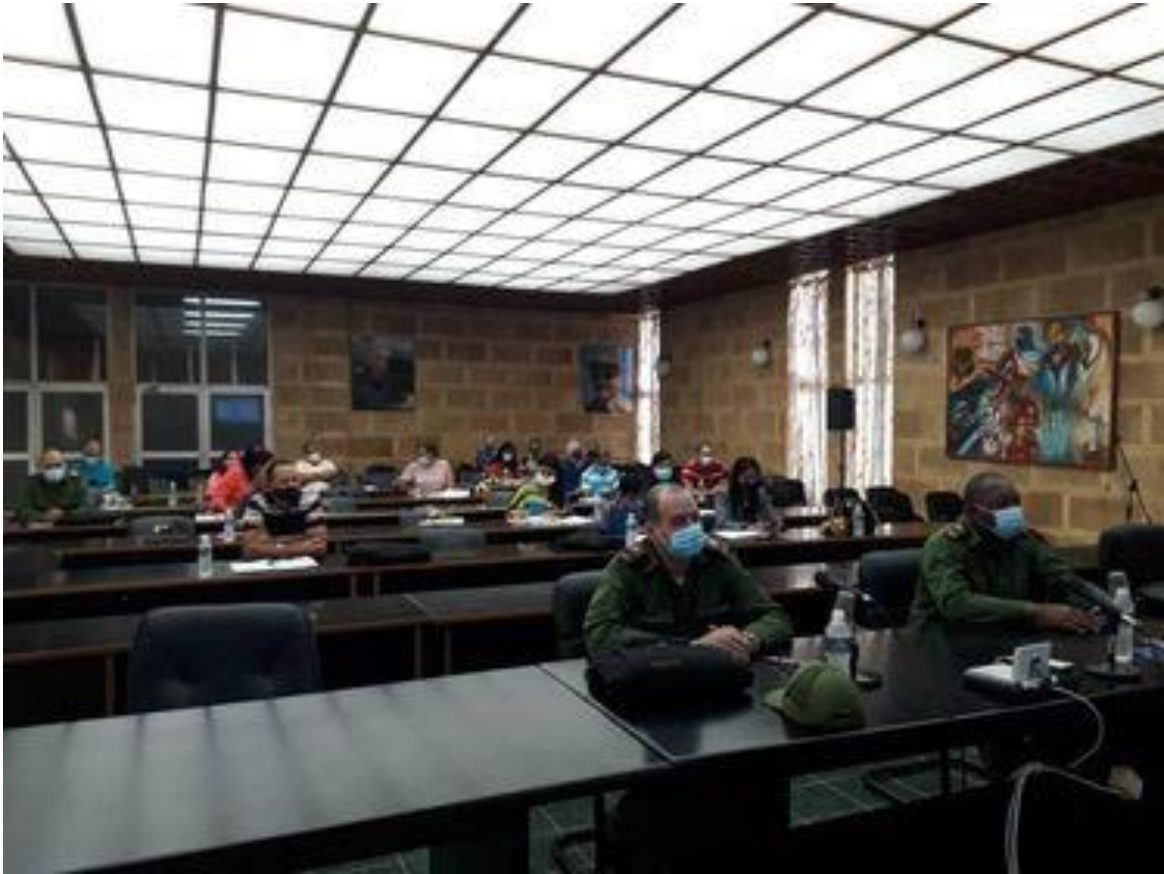
Diputados participan en sesión previa a la sesión ordinaria de la Asamblea Nacional.