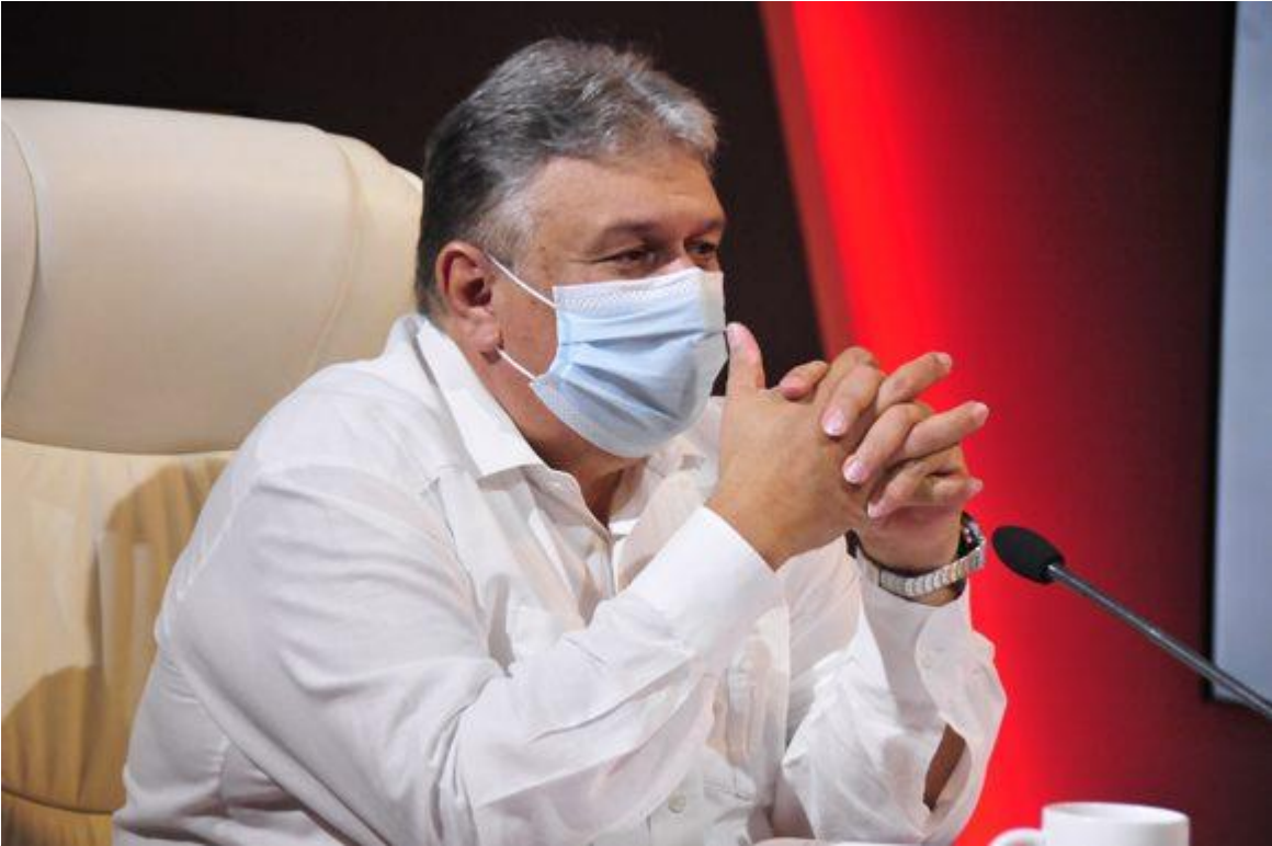
Marino Murillo interviene en la Mesa Redonda.

En el segmento final de la Mesa Redonda de este sábado, el jefe de la Comisión de Implementación y Desarrollo de los Lineamientos, Marino Murillo Jorge, recordó que “no hay nada más complicado en una economía que la categoría precios. Casi que es más fácil hacer una reforma de salario que ordenar los precios.