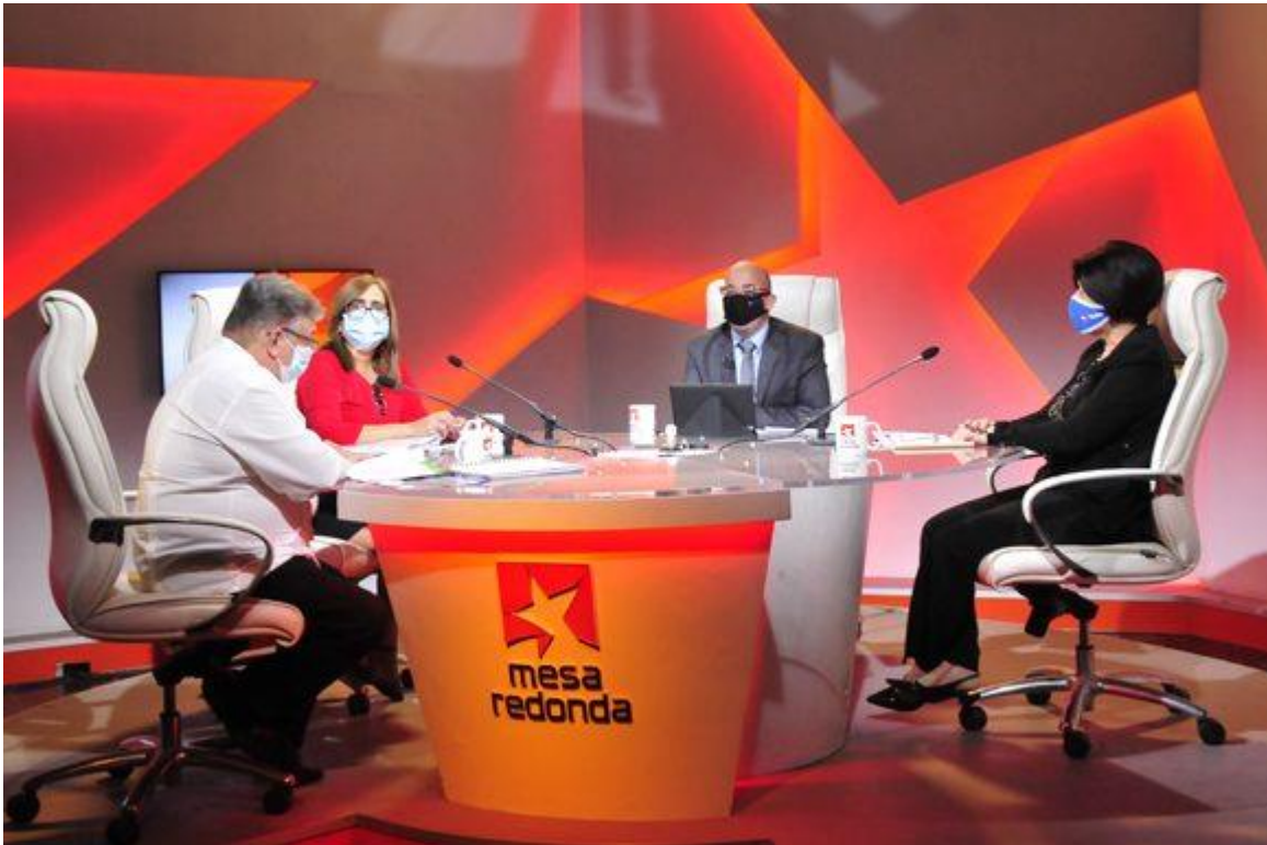
En la Mesa Redonda, salarios, tributos y prestaciones de la seguridad social.

En un primer acercamiento al tema del perfeccionamiento de los ingresos en el sector empresarial, que será tocado en próximos programas, la ministra informó que se eliminan los sistemas de pago por resultados, asociados al cumplimiento de indicadores límites y directivos.